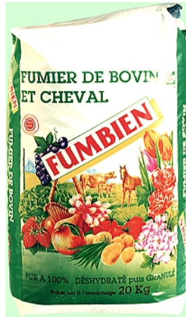
Sac de 20 kg

DANS FUMBIEN, IL N'Y A QUE DU FUMIER DE BOVIN ET DE CHEVAL PUR A 100% POUR FUMER NATURELLEMENT VOTRE SOL EN TOUTES SAISONS