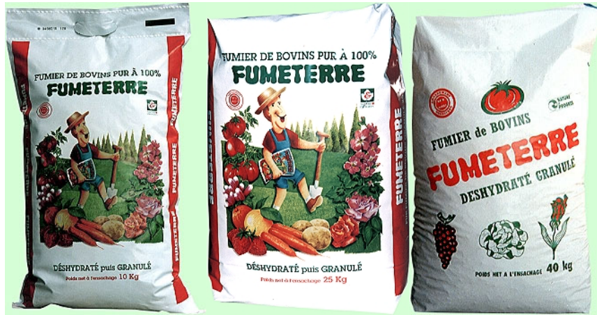
Sac de 10 kg